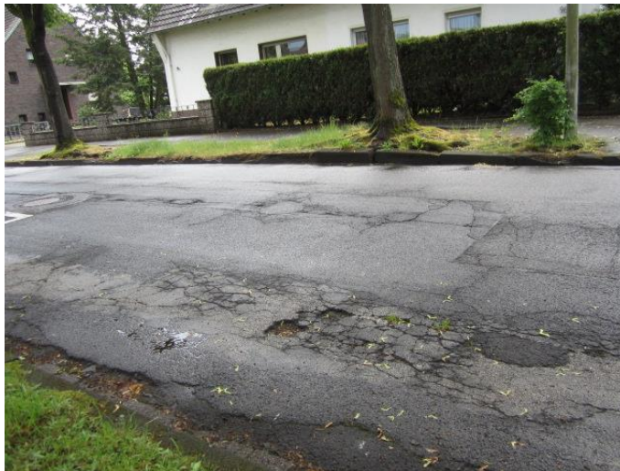
Bild 4: Beispiel schadhafte Fahrbahn und durch Wurzeln gehobene Borde 1

Ausbrüche. Allgemein weist die Decke einen ungleichförmigen Zustand auf und ist geprägt durch eine große Anzahl von Ausbesserungsstellen. In der Straße sind verschiedene Längsaufbrüche vorhanden, so dass es mehrere große Schwarzdeckenfraktionen in der Straße gibt. Teilweise ist im Altbestand die Decke schon soweit aufgelöst, dass die unterhalb liegende Frostschuttschicht/Packlage zu sehen ist. Zumindest in diesen Teilbereichen ist von einer sehr geringen Deckenstärke des vorhandenen Aufbaus auszugehen. Die Rinnenanlage der Fahrbahn ist uneben und ungleichförmig. Aufgrund des geringen Längsgefälles in der Straße ist somit im Niederschlagsfall mit Pfützenbildungen zu rechnen. Insbesondere im Bereich von Baumwurzeln sind größere Erhebungen in der Rinnenanlage vorhanden.