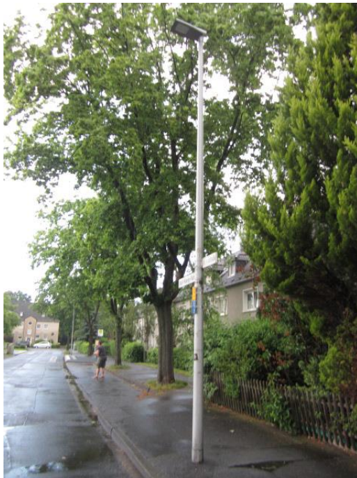
Bild 1: vorh. Straßenlaterne als Beispiel (dieser Lampentyp steht im gesamten Planungsabschnitt)

Eine Straßenbeleuchtung ist vorhanden. Der Abstand der Leuchten zueinander beträgt i.M. 50 m.